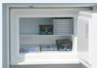
Abschliessbare Datenbox (60 Min.)