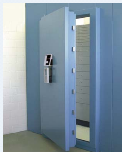
Die Tresortüren werden mit dem Hochsicherheits-Verschluss-System Paxos® compact ausgerüstet