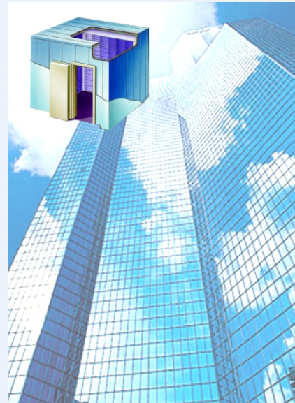
Sicherheitsraum auch für luftige Höhen

Die Eingabe- und die Schlosseinheit sind durch elektronische Überwachung und raffinierte Sperren in höchstem Masse manipulations- und sabotagesicher.