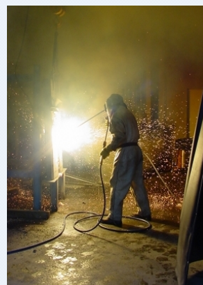
Selbst den aggressivsten elektromechanischen und thermischen Angriffswerkzeugen haben die Wertschutzräume standgehalten