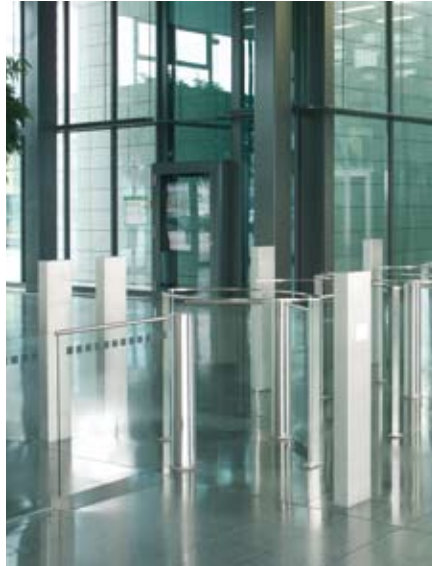
Mit passender Schwenktür als barrierefreie Lösung