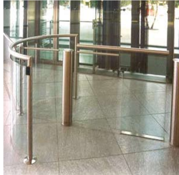
Platz sparende Lösung mit integrierter Schwenktür für Materialtransporte