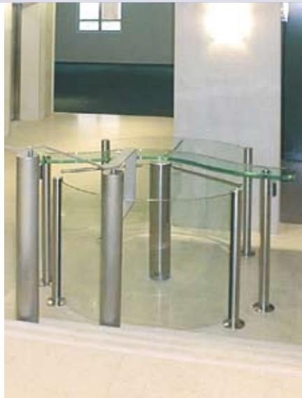
Eine enge Durchgangssituation elegant gelöst mit Charon