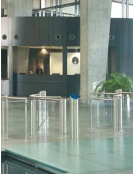
Mehrfachanlage im Foyer - in Sichtweite vom Empfangspersonal