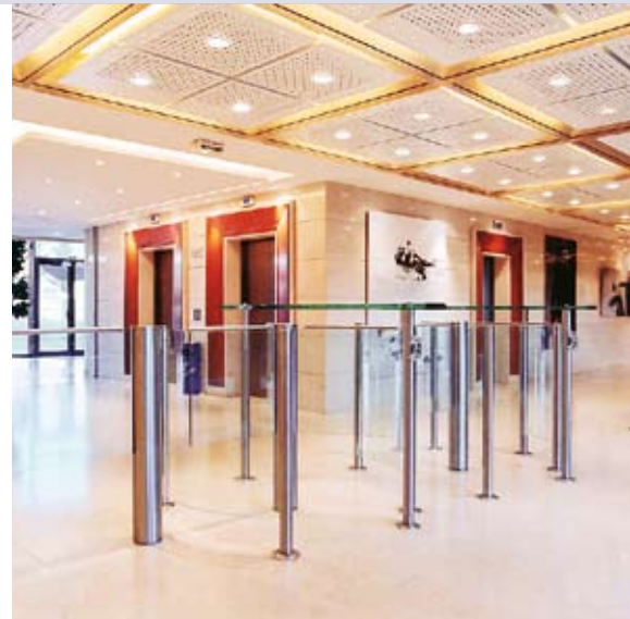
Sonderausführung mit erhöhten Glasflügeln