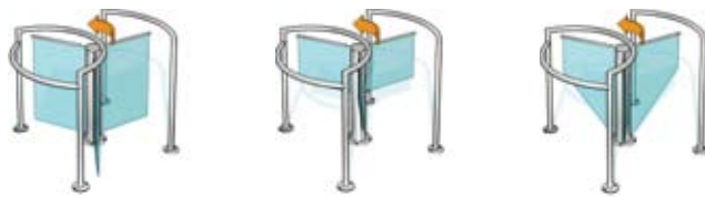
Glaselement in 3 Varianten