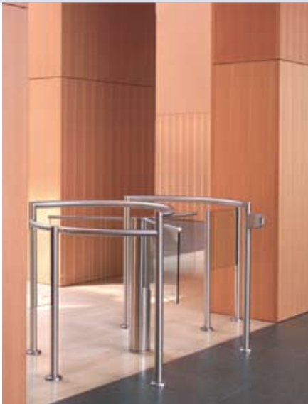
Harmonisch kombiniert: Warmes Holz, Glas und Edelstahl