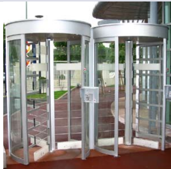
Sicherheitsdrehkreuze, Außenaufstellung - Doppelanlage mit Sperrelementen aus Acrylglas