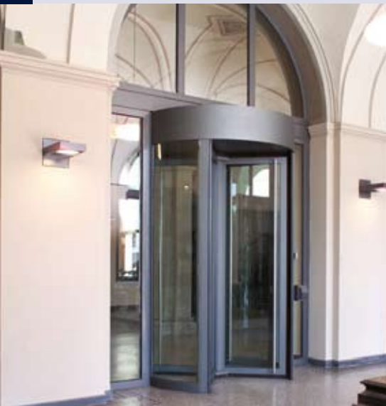
Flexible Integration - Sicherheitskarusselltür in historischer Kulisse