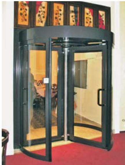
Sicherheitskarusselltür mit geprüfter Fluchtsäule - Türflügel manuell abklappbar