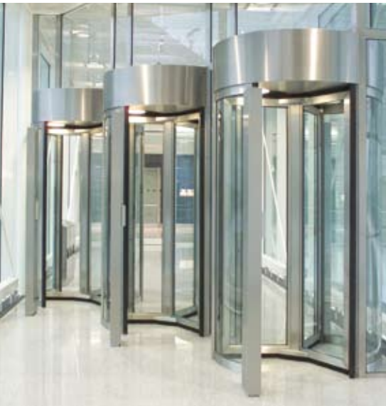
Diagonale Anordnung für schmale Durchgänge - Mehrfachanlage als Personaleingang am Flughafen