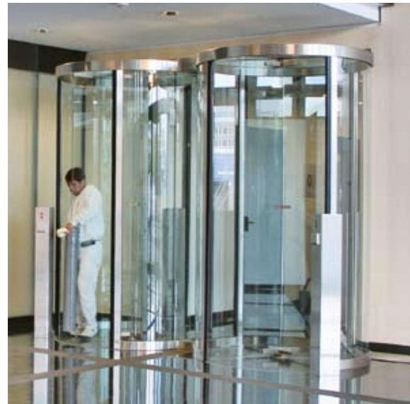
Maximale Transparenz - Doppelanlage in Ganzglasausführung