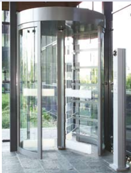
Stilvolle Lösung für Innenaufstellung - Sicherheitsdrehkreuz mit Sperrelementen aus Acrylglas